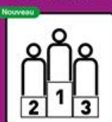
Compétitions autorisées, sans public