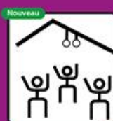
Sport en intérieur autorisé