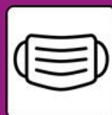
Masque obligatoire pour les entraîneurs en tout temps et pour les gymnastes des 12 ans dans les vestiaires et hall