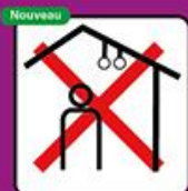
Sport en intérieur interdit