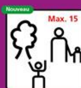
Groupes Parents-Enfants et jeunesse autorisés en extérieur, maximum 15 pers. enfants compris