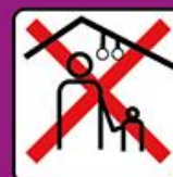
Groupes Parents-Enfants interdits en intérieur